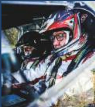
CAMPIONATO ITALIANO RALLY CHALLENGER