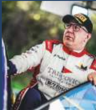
COPPA RALLY CRZ 5