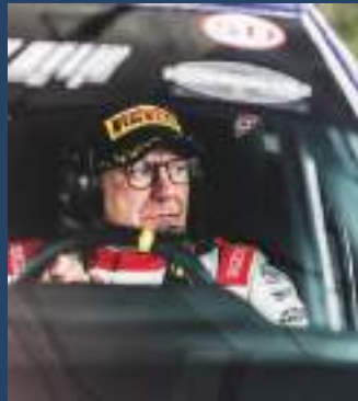
COPPA RALLY CRZ 3